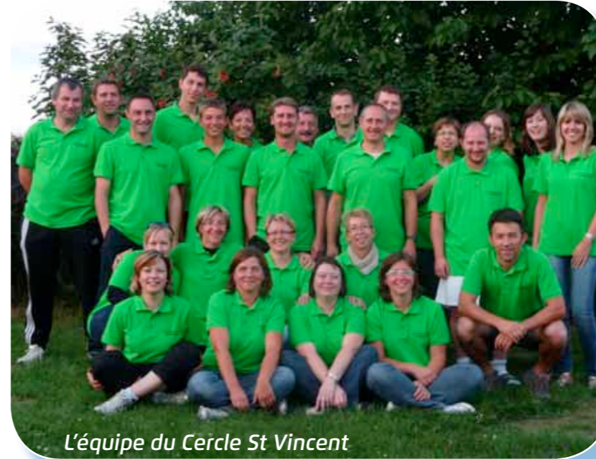
L'équipe du Cercle St Vincent

A cette occasion, un petit cadeau a été remis aux CM2, qui viennent de quitter le doux cocon de l'école primaire !