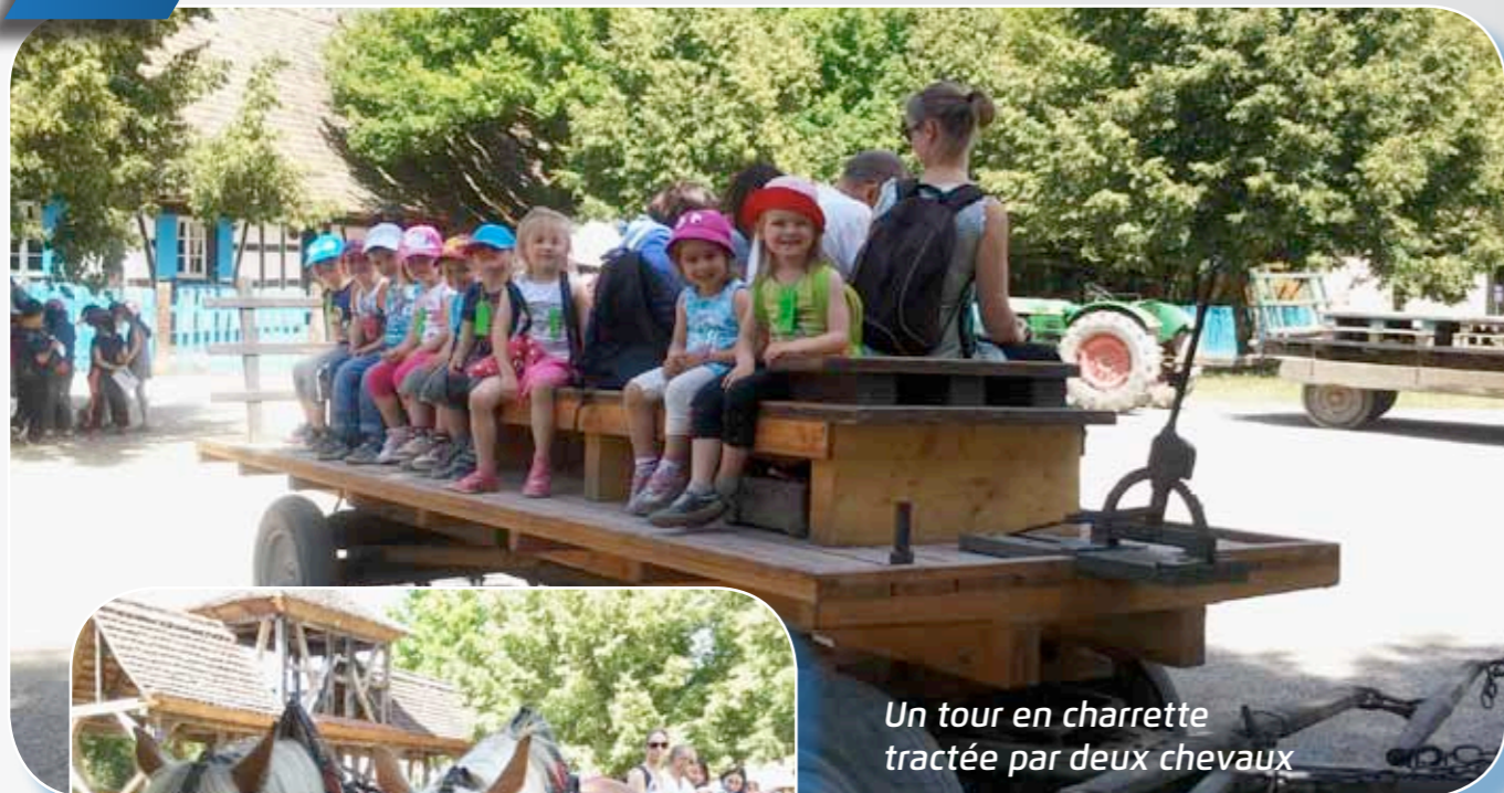
Un tour en charrette tractée par deux chevaux