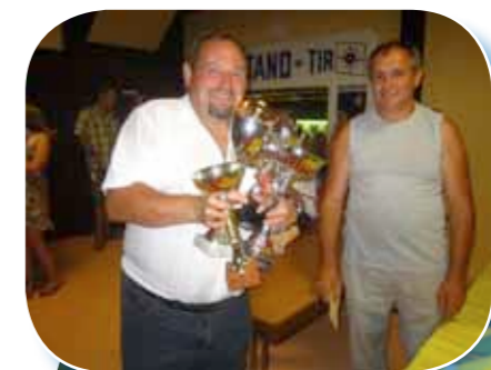
Fête du Tir 2013

Elle vous convie également à une après-midi dansante sous les sons de l'orchestre « Valéry's ». À partir de 18 heures, elle vous propose de succulentes tartes flambées et grillades.