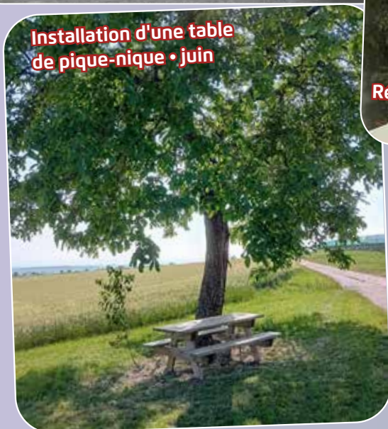
Installation d'une table de pique-nique • juin