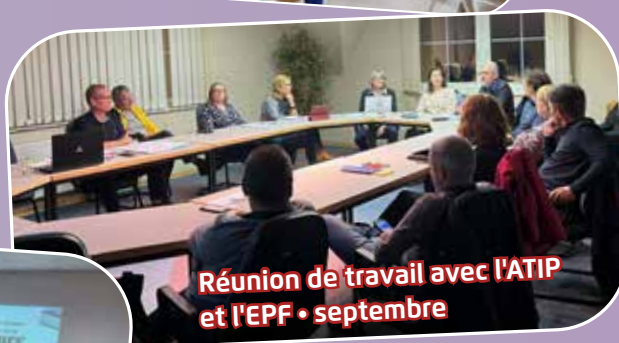
Réunion de travail avec l'ATIP et l'EPF • septembre