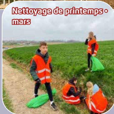
Nettoyage de printemps • mars