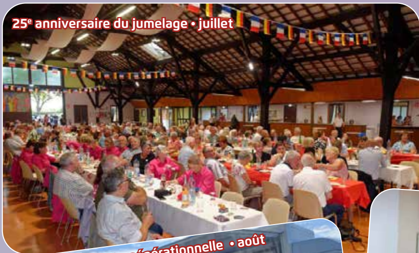
25 e anniversaire du jumelage • juillet