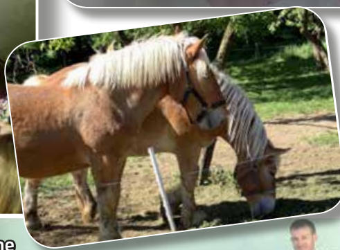
Visite d'une ferme pédagogique