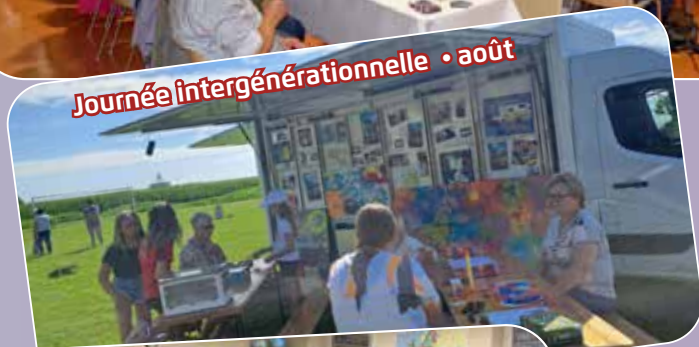
Journée intergénérationnelle • août