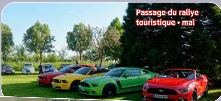
Passage du rallye touristique • mai