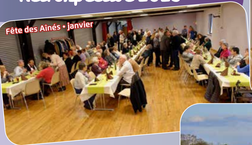
Fête des Aînés • janvier