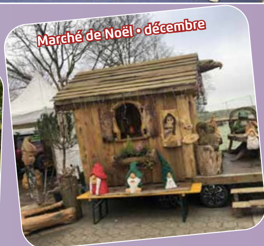
Marché de Noël • décembre