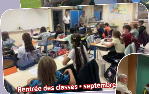
Rentrée des classes • septembre