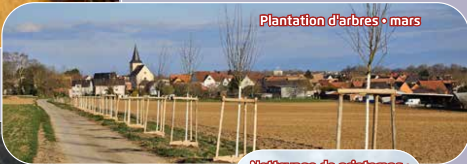
Plantation d'arbres • mars