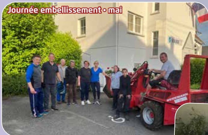
Journée embellissement • mai