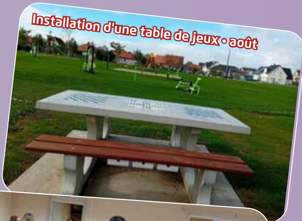
Installation d'une table de jeux • août