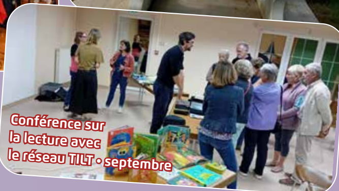
Conférence sur la lecture avec le réseau TILT • septembre