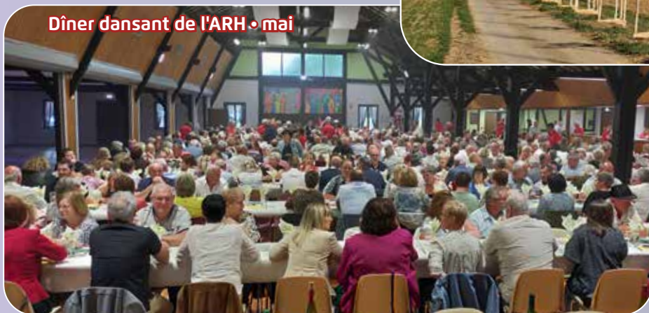
Dîner dansant de l'ARH • mai